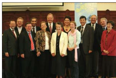
Der neue Rat der GEKE

Die GEKE weiß sich, ganz im Geist der Konkordie, der ökumenischen Bewegung voll verpflichtet. Die Vollversammlung stellte fest, dass das Modell des differenzierten Konsenses nicht nur innerevangelisch, sondern auch mit anderen Kirchen ein zukunftsfähiges Modell ist. Die Delegierten beschlossen einstimmig, die bereits begonnenen Dialoge (mit den anglikanischen Kirchen mit dem Ziel, eine gesamteuropäische gegenseitige Gemeinschaft zu erklären, mit den baptistischen und mit den orthodoxen Kirchen zur Anerkennung der Taufe) weiterzuführen. Die Zusammenarbeit mit der KEK wurde